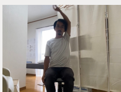
①腕を横から上げる